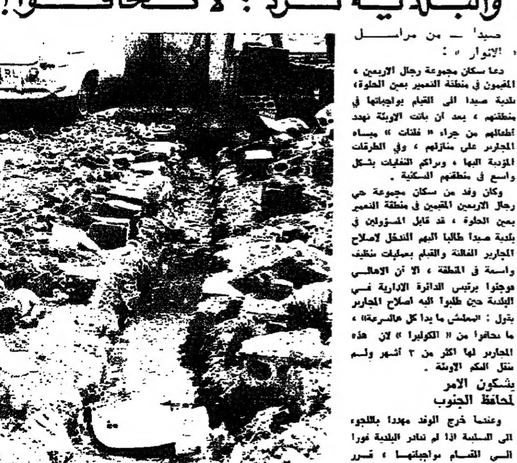
أحد المجاير المشققة في منطقة التعمير

دعا سكان مجموعة رجال الارمين ، المقيمون في منطقة التعمير بين الحارة ، بلدية صيدا الى القيام بواجبها في تنظيفهم ، بعد ان باتت الازمة تهدد اطفالهم من جراء " فطانت " مياه المجاير على منازلهم ، وفي الطرقات المحيطة بها ، وبرامك التفكيك بشكل واسع في منطقتهم السكنية . وكان وفد من سكان مجموعة حي رجال الارمين المقيمين في منطقة التعمير بين الحارة ، قد قابل المسؤولين في بلدية صيدا طالبا اليهم التدخل لاصلاح المجاير المفلتة والقمام بعمليات تنظيف واسعة في المنطقة ، لان ان الاملاسي موجودا برئيس القذافي الادارية قسري البلدية حين طلبوا اليه اصلاح المجاير بتقول : البمش ما يدا كل حالسرة ، ما نحافوا من " الكوليرا " لان هذه المجاير لها اكثر من ٣ اشهر ولم تنقل الكم الاوتنة . يشكون الامر لحافظ الجنوب وعندما خرج الوفد مهددا بالجدوء الى البلدية اذا لم تدار البلدية تورا الى القمام بواجبها ، تسر الاهالي ان يقوموا بمناقشة جمعية للحفاظ على الشوارع واصحها الصحية . ونشى منطقة التعمير في عين الحارة منذ مدة طويلة ، وسط وحول مياه المجاير ورائحتها الكريهة ، والكوارم التفكيك التي تحاصر منازلهم ، دون ان يأمر البلدية الى القيام باعمال التصالحات والنظافة في تلك المنطقة الكوليرا . . .